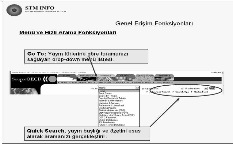
Resim 2: SourceOECD Genel Tarama Sayfası ve Seçenekler

Araştırmalar için gerekli olabilecek bütün OECD bilgi kaynakları, SourceOECD veri tabanı üzerinden çeşitli tarama yöntemleri (Bkz. Resim 2) kullanılarak saptanabilir ve erişilebilir. Ayrıca aramalar, genel kapsamda veya belirli yayın türlerine göre ya da gelişmiş arama arayüzü (Advanced Search) ile özelleştirerek, daha doğru ve özel düzeyde yapılabilir.